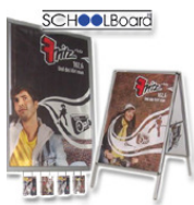
Plakate f. Grund-, Berufs- u. Oberschüler