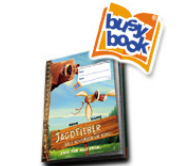
Schulhefte für Grundschüler